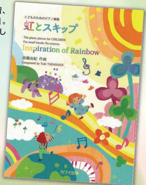
こどものためのピアノ曲集 虹とスキップ